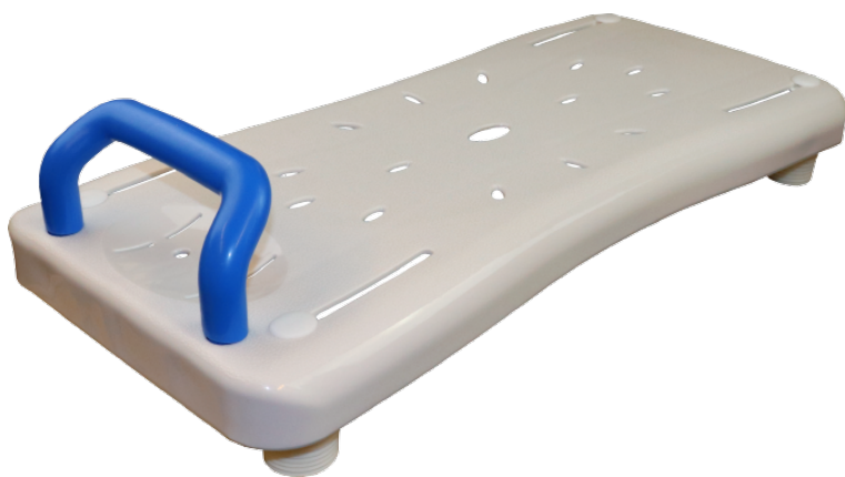
Seating support for bathtubs Adjustable to suit the most common bathtub widths

Montage- und Gebrauchsanleitung Montage- og brugervejledning User Manual Manuale d'uso e manutenzione