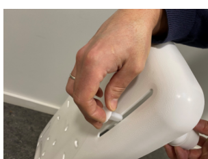
Plastskruen føres ned i slidsen på badebrættet og skrues fast i benet under brættet