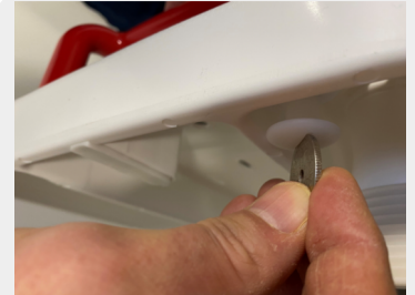
The handle is easily mounted A coin is enough to tighten the screws