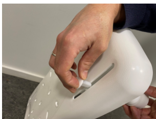
Die Schraube wird in den Schlitz eingeführt und in den Fuß eingeschraubt