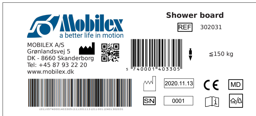
Abbildung des Typenschildes

Das Typenschild befindet sich auf der Unterseite des Brettes