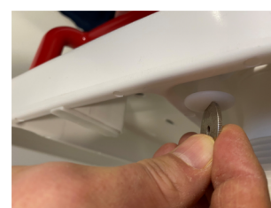
La maniglia va inserita da sopra nei 2 fori sulla vasca e fissata da sotto con le viti in plastica