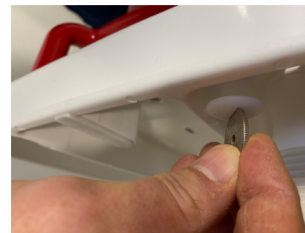
Der Handgriff wird mit 2 Schrauben von der Unterseite befestigt