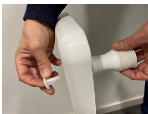
Die Füße werden mit den Plastikschrauben befestigt