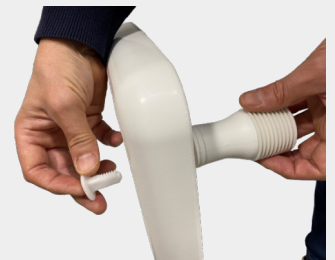
The supporting legs are easily mounted. No tools needed. The screws can be tightened by hand.